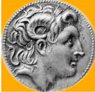
Moneda que muestra a Alejandro con dos cuernos, acuñada alrededor de 355-281 A.C.